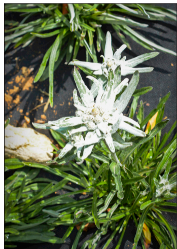
Vliesschutz für die Edelweiss-Jungpflanzen.

Schutzmechanismen entwickelt, um der Kälte und der starken Sonneneinstrahlung in den Bergen zu trotzen.» In der Edelweiss-Pflanze sei ein hoher Gehalt an Antioxidantien nachgewiesen worden. Zusätzlich enthält die Pflanze Wirkstoffe, welche entzündungshemmend wirken und der Hautalterung vorbeugen. Alle diese Stoffe sind in den Cremes von Edelweiss Cosmétique enthalten. Um sie zu gewinnen, werden die Blüten zuerst schonend getrocknet und