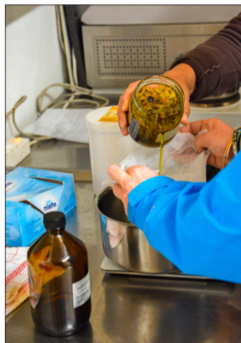
Ringelblumenextrakt wird beigemischt.

Schutzmechanismen entwickelt, um der Kälte und der starken Sonneneinstrahlung in den Bergen zu trotzen.» In der Edelweiss-Pflanze sei ein hoher Gehalt an Antioxidantien nachgewiesen worden. Zusätzlich enthält die Pflanze Wirkstoffe, welche entzündungshemmend wirken und der Hautalterung vorbeugen. Alle diese Stoffe sind in den Cremes von Edelweiss Cosmétique enthalten. Um sie zu gewinnen, werden die Blüten zuerst schonend getrocknet und