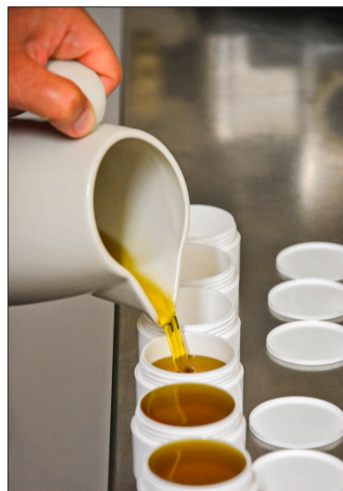
Edelweiss-Salbe wird in Dosen abgefüllt.

danach in Jojobaöl eingelegt und ins Dunkle gestellt. «Nach mehreren Wochen sind die Wirkstoffe des Edelweiss im Jojobaöl enthalten. Dieser Extrakt wird für jede Rezeptur unserer Produkte verwendet. Jeder Produktionsvorgang ist ein genaues Abwägen und sorgfältiges Zusammenfügen der Zutaten. Die genauen Rezepte bleiben aber natürlich geheim.» Alle Produkte von Edelweiss Cosmétique sind tierversuchsfrei und zu 100 Prozent natürlich. Sie enthalten keine